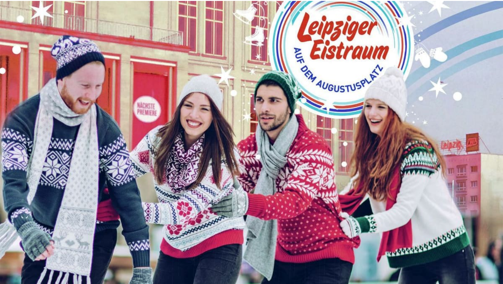
"Leipziger Eistraum" vor dem Opernhaus auf dem Augustusplatz