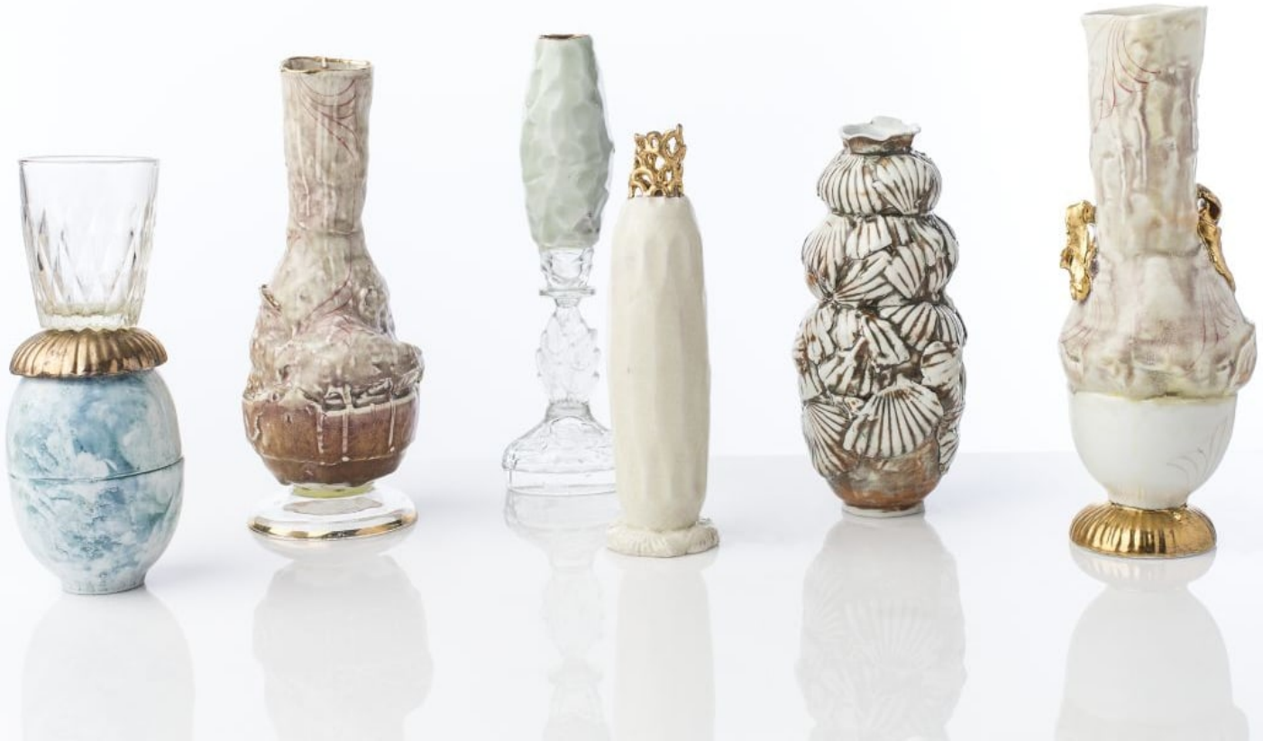
Materialcollage aus Porzellan, Glas und Gold von Sarah Pschorn