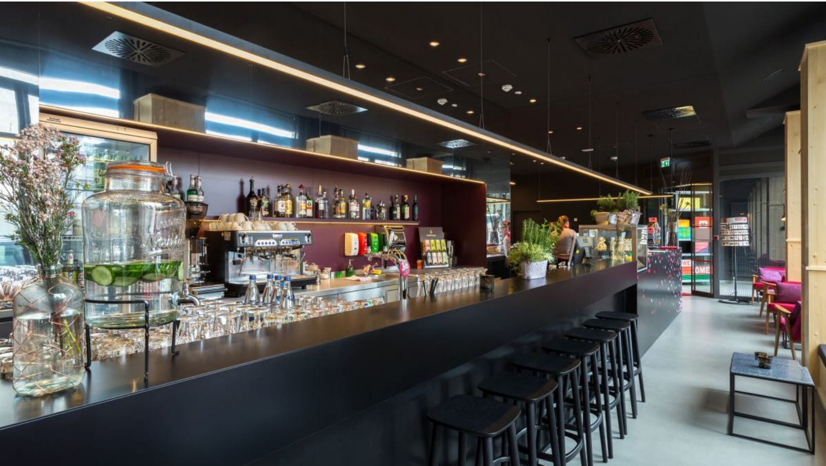
Bar und Eingangsbereich im Meininger Hotel Leipzig Hauptbahnhof