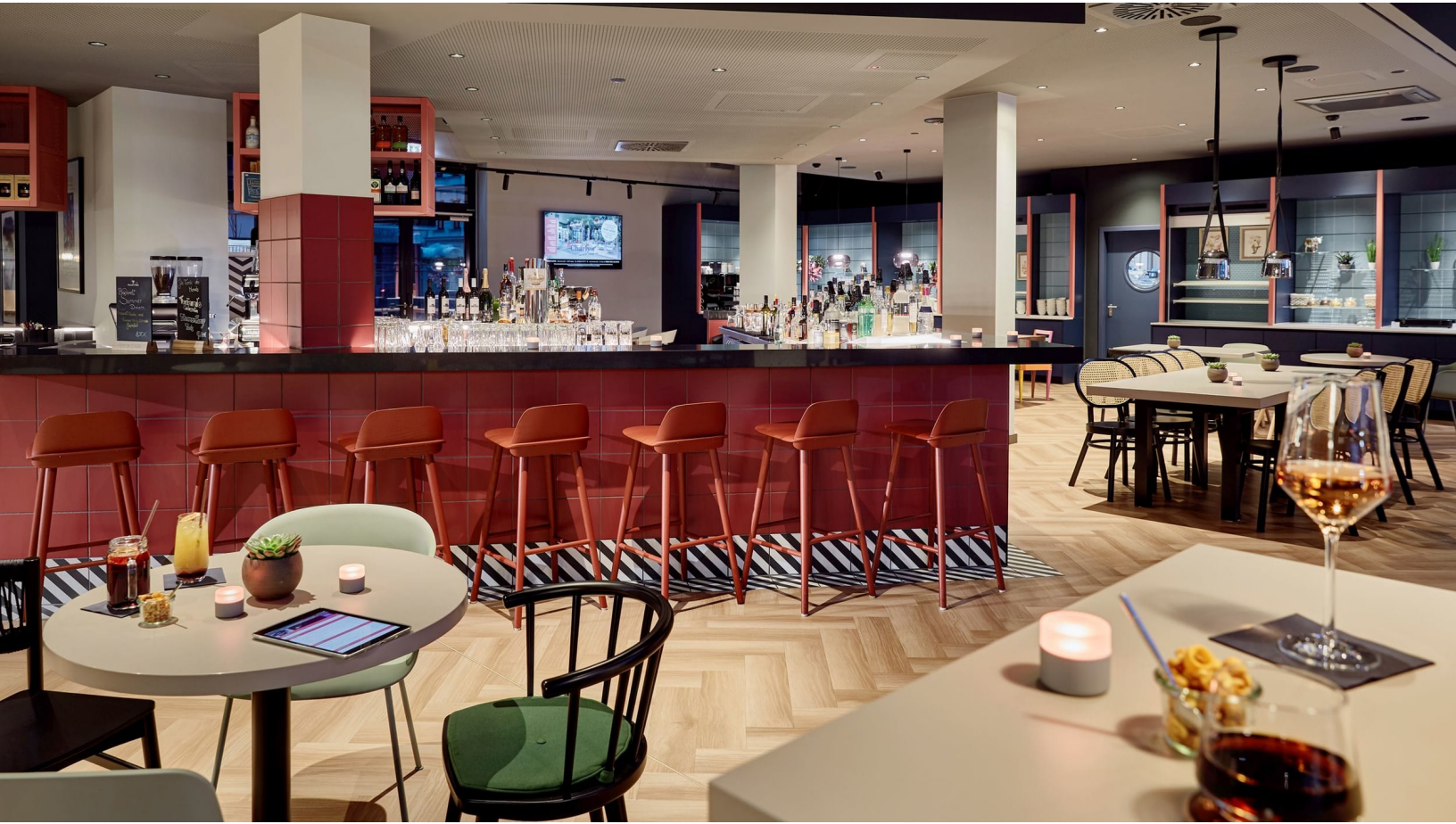
Charly's Bar & Lounge in der Hotelloobby des Légère Express