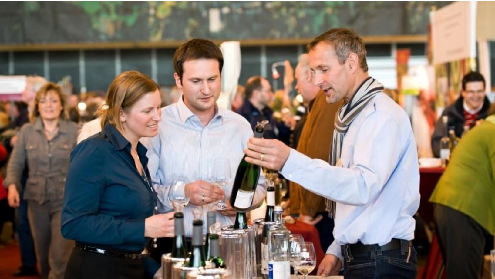
Weinverkostung auf der WeinMesse Rheinland-Pfalz