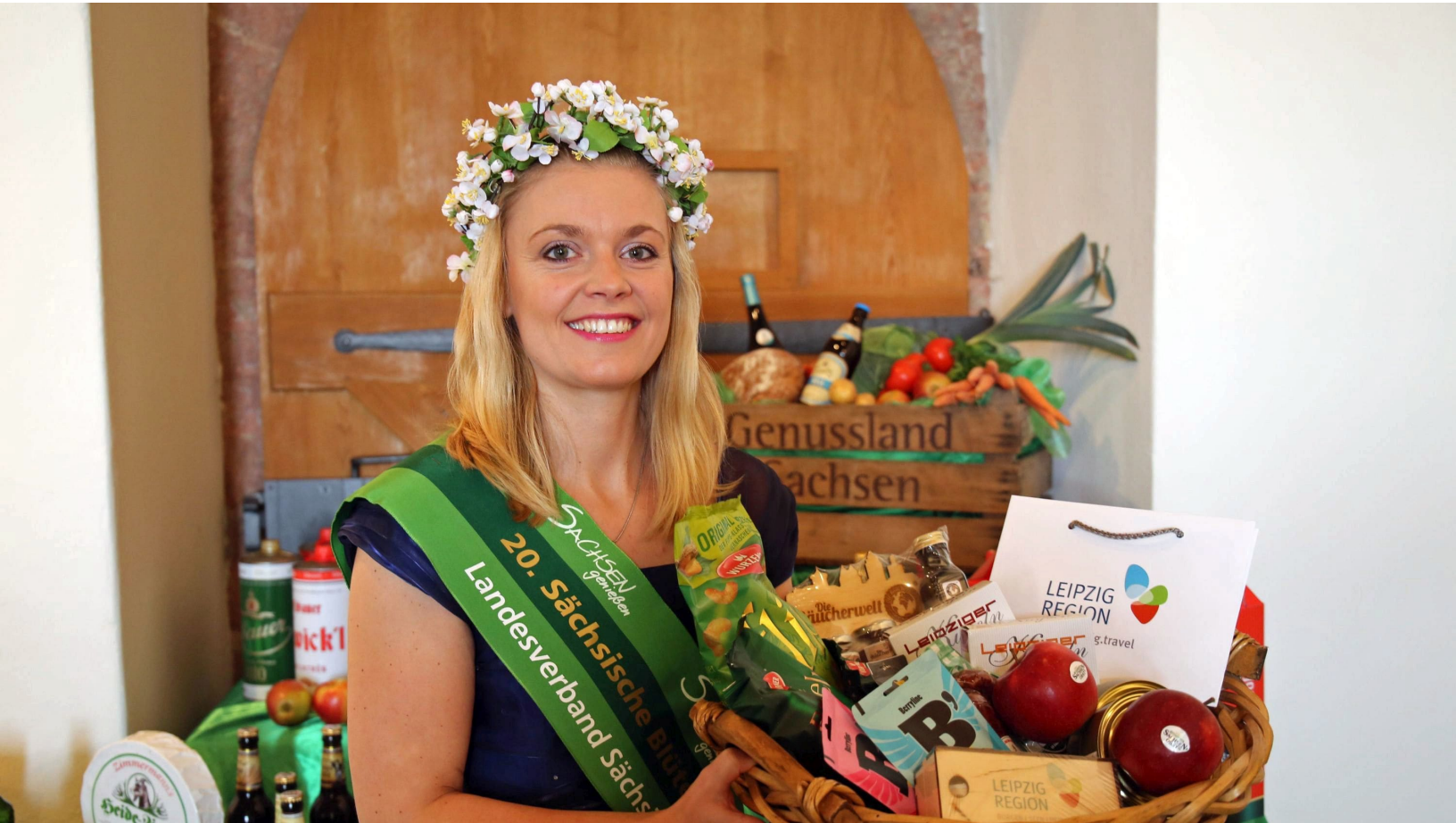
Sächsische Produkte auf der Grünen Woche