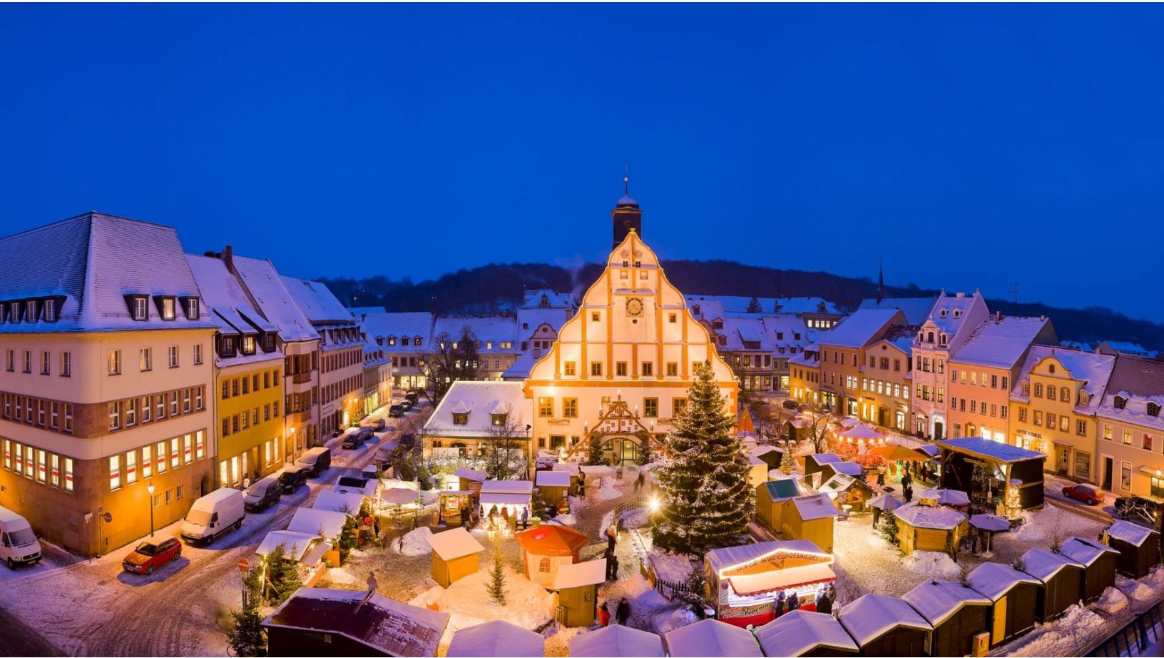
Lichterglanz auf dem Weihnachtsmarkt in Grimma